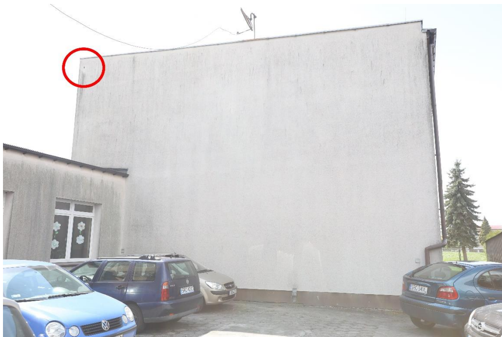
Zdjęcie nr 9

Zespół Szkolno – Przedszkolny w Borucinie