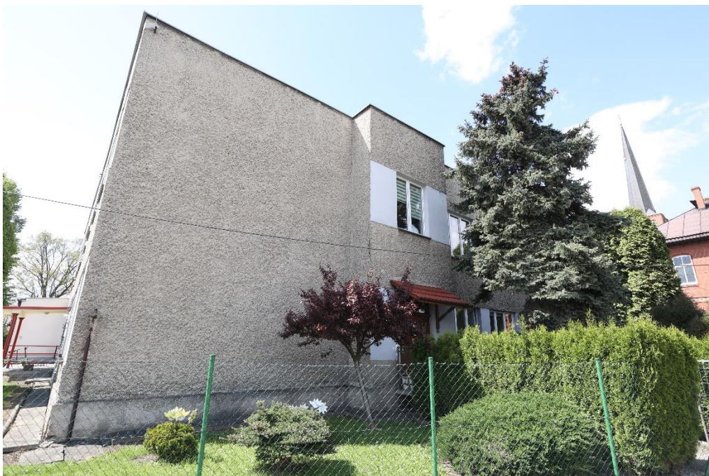
Zdjęcie nr 16 Zespół Szkolno – Przedszkolny w Borucinie Strona wsch. Data 25.04.2024r. Ściana planowana do modernizacji