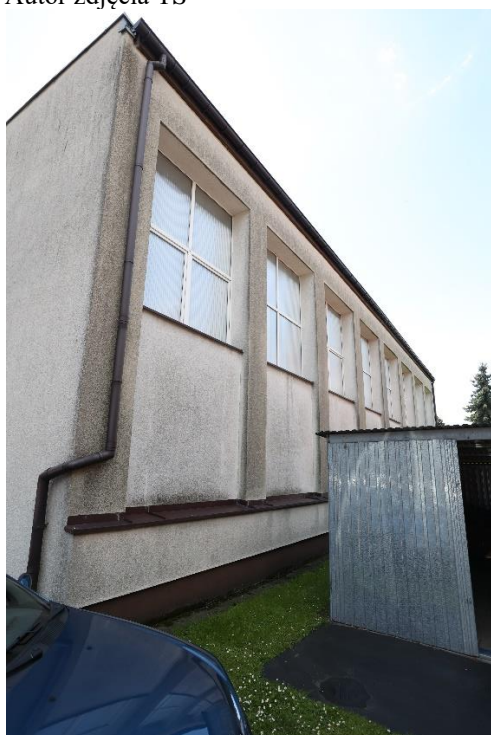
Zdjęcie nr 8 Zespół Szkolno – Przedszkolny w Borucinie Strona pñ. Data 25.04.2024r. Ściana planowana do modernizacji