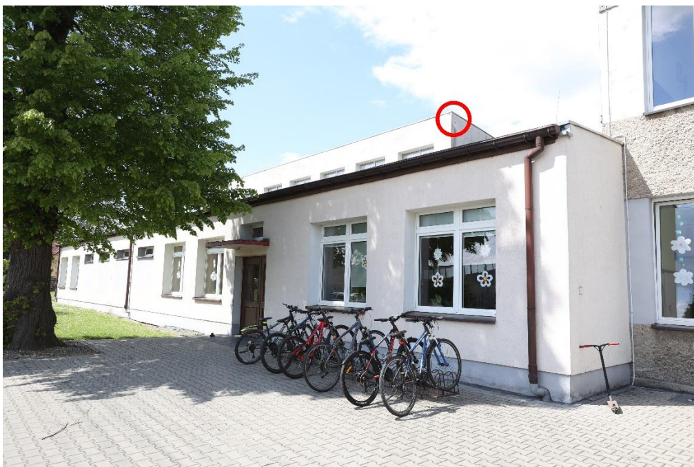
Zdjęcie nr 2 Zespół Szkolno – Przedszkolny w Borucinie Strona pld. Data 25.04.2024r. Ściana frontowa planowana do modernizacji oraz miejsce łęgowe mazurka