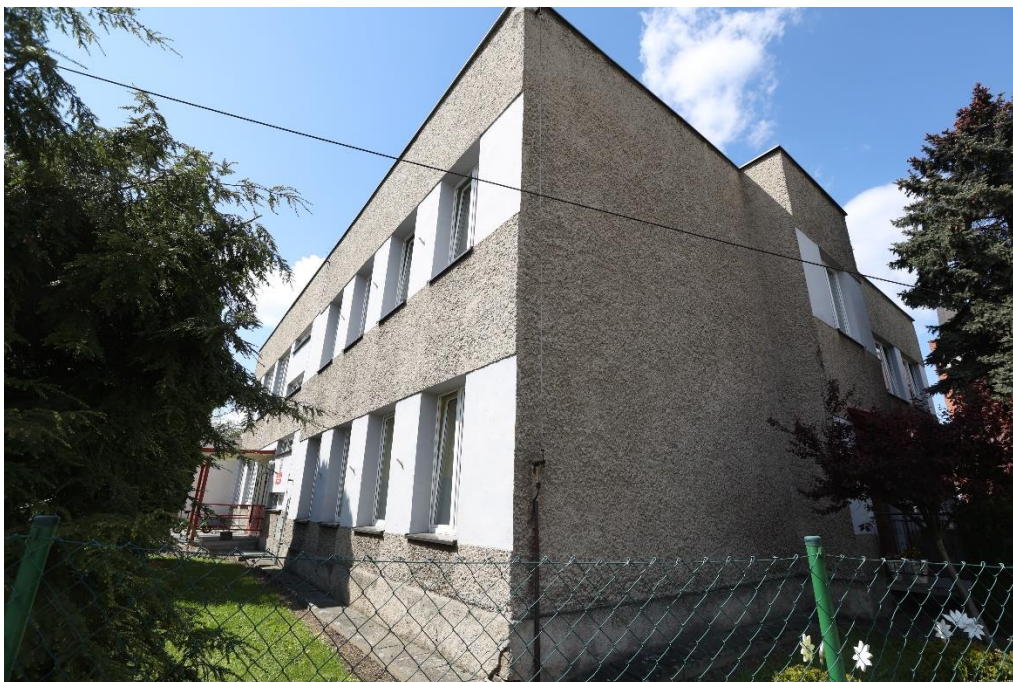
Zdjęcie nr 17 Zespół Szkolno – Przedszkolny w Borucinie Strona pld. Data 25.04.2024r. Ściana planowana do modernizacji