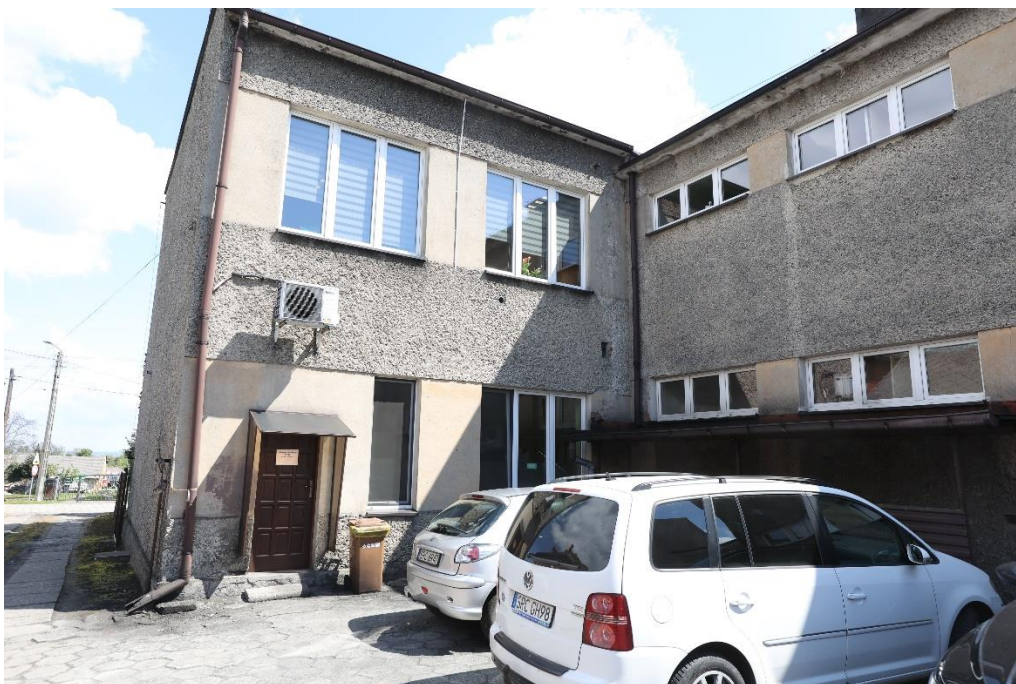
Zdjęcie nr 13 Zespół Szkolno – Przedszkolny w Borucinie Strona wsch. Data 25.04.2024r. Ściana planowana do modernizacji