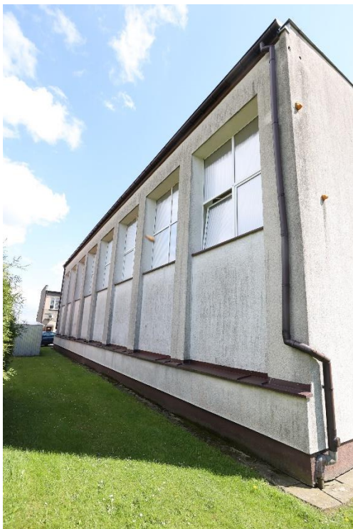
Zdjęcie nr 7 Zespół Szkolno – Przedszkolny w Borucinie Strona pñ. Data 25.04.2024r. Ściana planowana do modernizacji