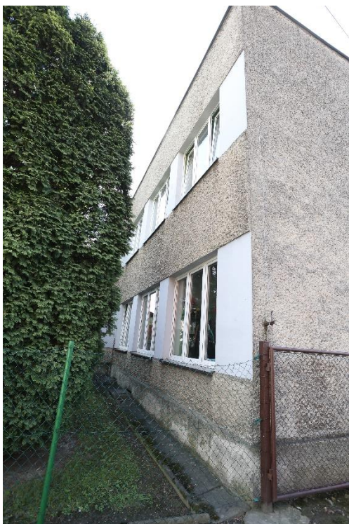
Zdjęcie nr 15 Zespół Szkolno – Przedszkolny w Borucinie Strona wsch. Data 25.04.2024r. Ściana planowana do modernizacji