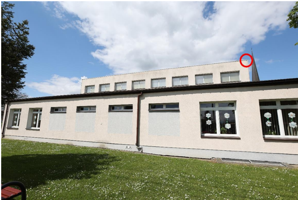
Zdjęcie nr 3 Zespół Szkolno – Przedszkolny w Borucinie Strona pld, Data 25.04.2024r. Miejsce lęgowe mazurka