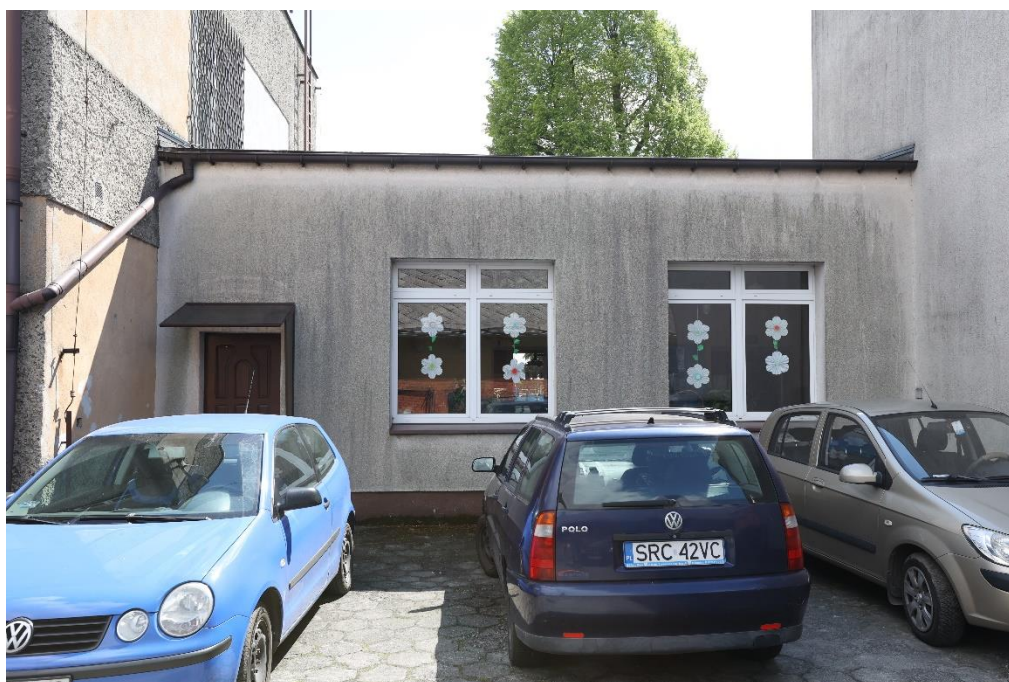
Zdjęcie nr 10

Zespół Szkolno – Przedszkolny w Borucinie