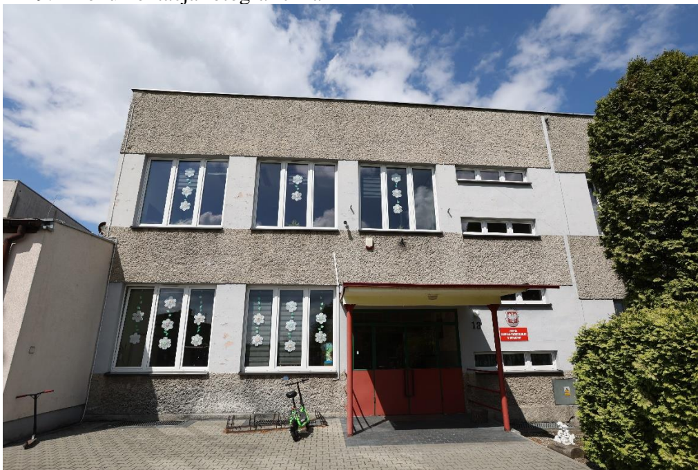
Zdjęcie nr 1 Zespół Szkolno – Przedszkolny w Borucinie Strona pld. Data 25.04.2024r. Ściana frontowa planowana do modernizacji