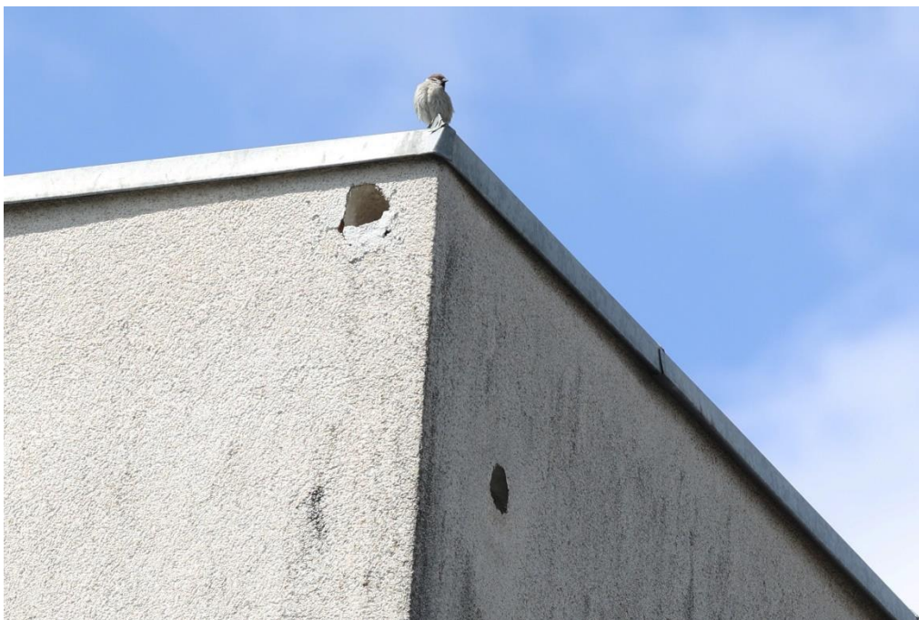
Zdjęcie nr 4 Zespół Szkolno – Przedszkolny w Borucinie Strona pld, Data 25.04.2024r. Mazurek przy miejscu lęgowym