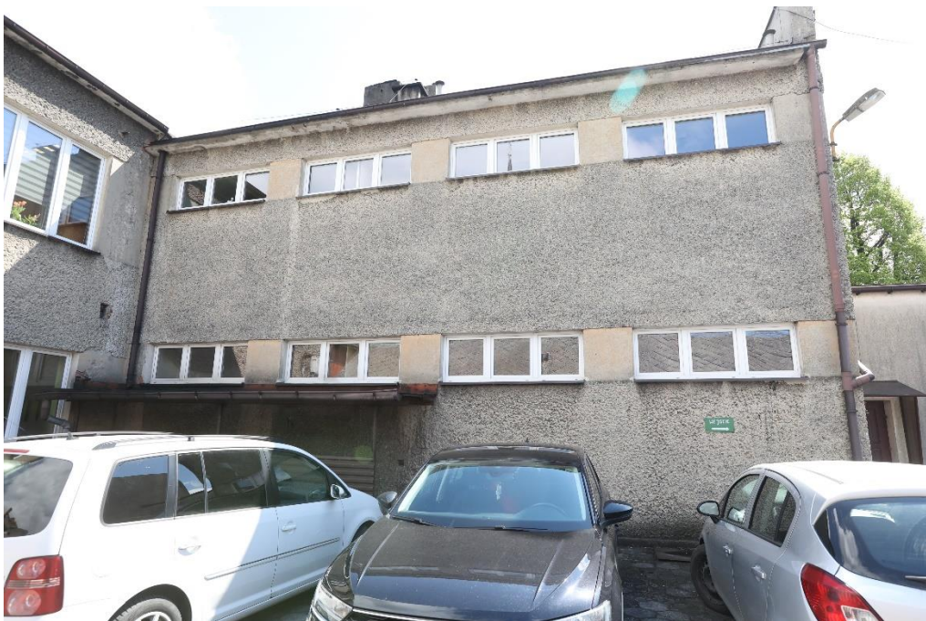
Zdjęcie nr 12 Zespół Szkolno – Przedszkolny w Borucinie Strona płn. Data 25.04.2024r. Ściana planowana do modernizacji.