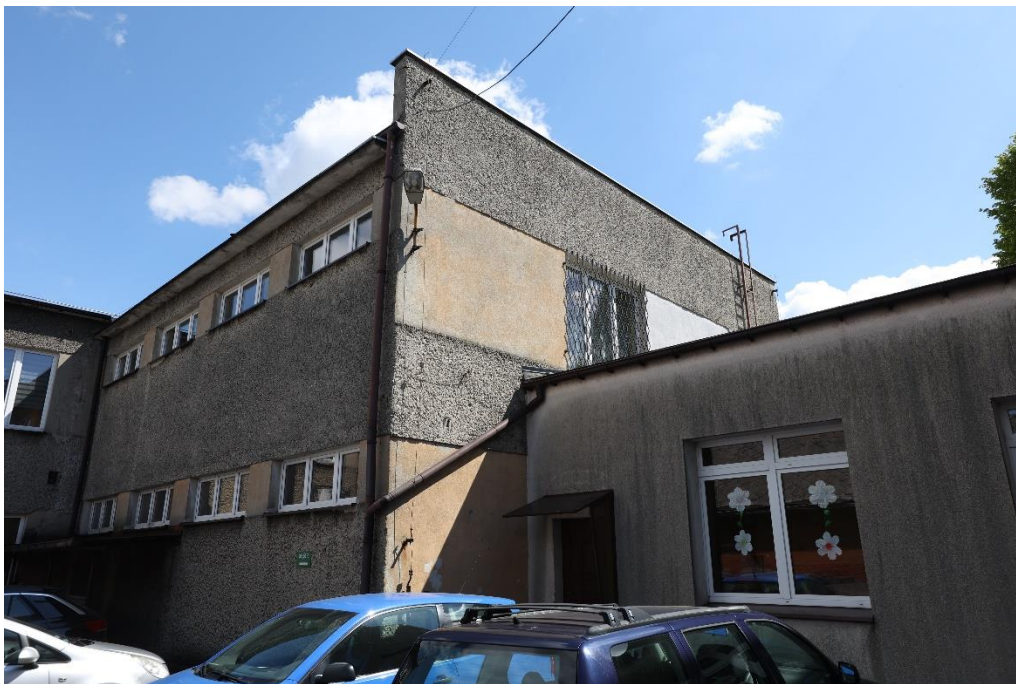
Zdjęcie nr 11 Zespół Szkolno – Przedszkolny w Borucinie Strona płn. Data 25.04.2024r. Ściany planowane do modernizacji