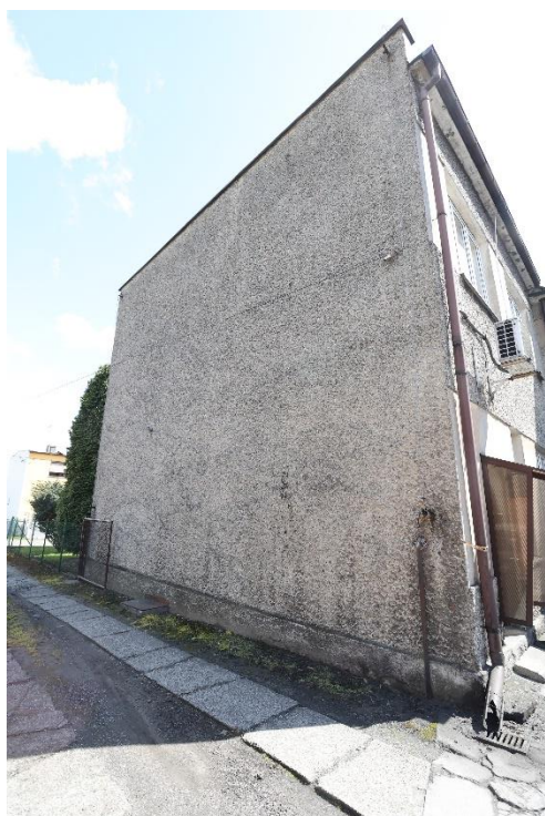
Zdjęcie nr 14 Zespół Szkolno – Przedszkolny w Borucinie Strona pñ. Data 25.04.2024r. Ściana planowana do modernizacji